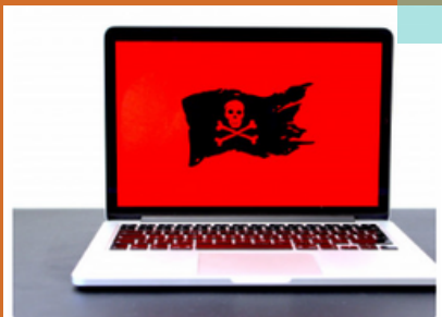
IO1 - Research analysis

Das Dokument ist unter folgendem Link abrufbar: https://www.cybervet.eu/en/outputs/io1-research-analysis/